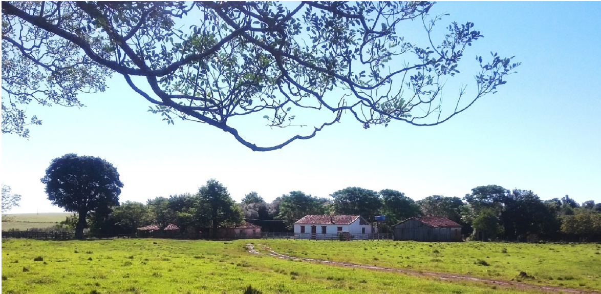
Figura 02 – Visual do observador ao aproximar-se da Fazenda.

intenção de tombar o local, este se enquadraria como um patrimônio municipal cultural, devido a sua significância por ser o local onde imigrantes italianos começaram a vida e estimularam e ainda influenciam no crescimento para o município.