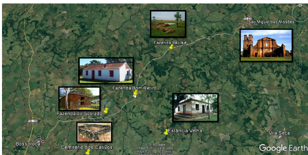
Figura 05 - Percurso das Fazendas

O Percurso se inicia no município de São Miguel das Missões e ao longo do caminho percorre as fazendas com relevância histórica, até o município de Bossoroca, conforme a Figura 05.